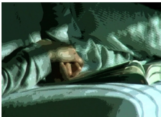
conception graphique Maurice Renoma

Quand bien même il serait esprit libre, quelque chose de néanmoins pesant et sérieux se faufile dans certaines de ses images et il en découle alors un trouble et une intrigue. L'observateur peut alors prendre conscience du danger et l'obscurité qui, toujours, poursuivront le libre esprit.