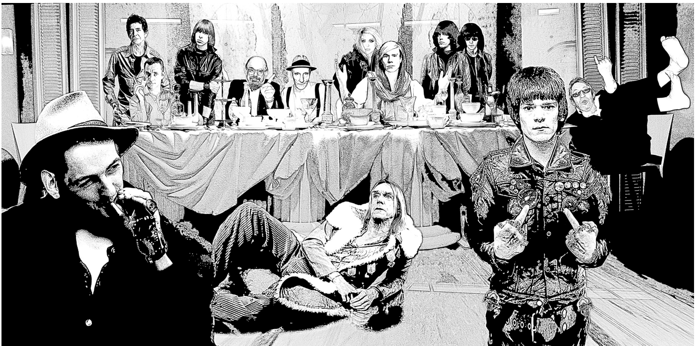
conception graphique Maurice Renoma

A travers une sélection de photos retraçant son chemin photographique, Maurice Renoma nous accueille dans son univers fantasmagorique et sans tabou aucun. Il est vrai, Maurice Renoma se veut en marge de la société, il s'amuse à imaginer son propre chemin ; si dissonant qu'il puisse être, il s'est donné l'entière liberté de le dessiner. Se voulant lui-même renégat, il puise son inspiration dans les contre cultures et les rencontres libres et indécentes.