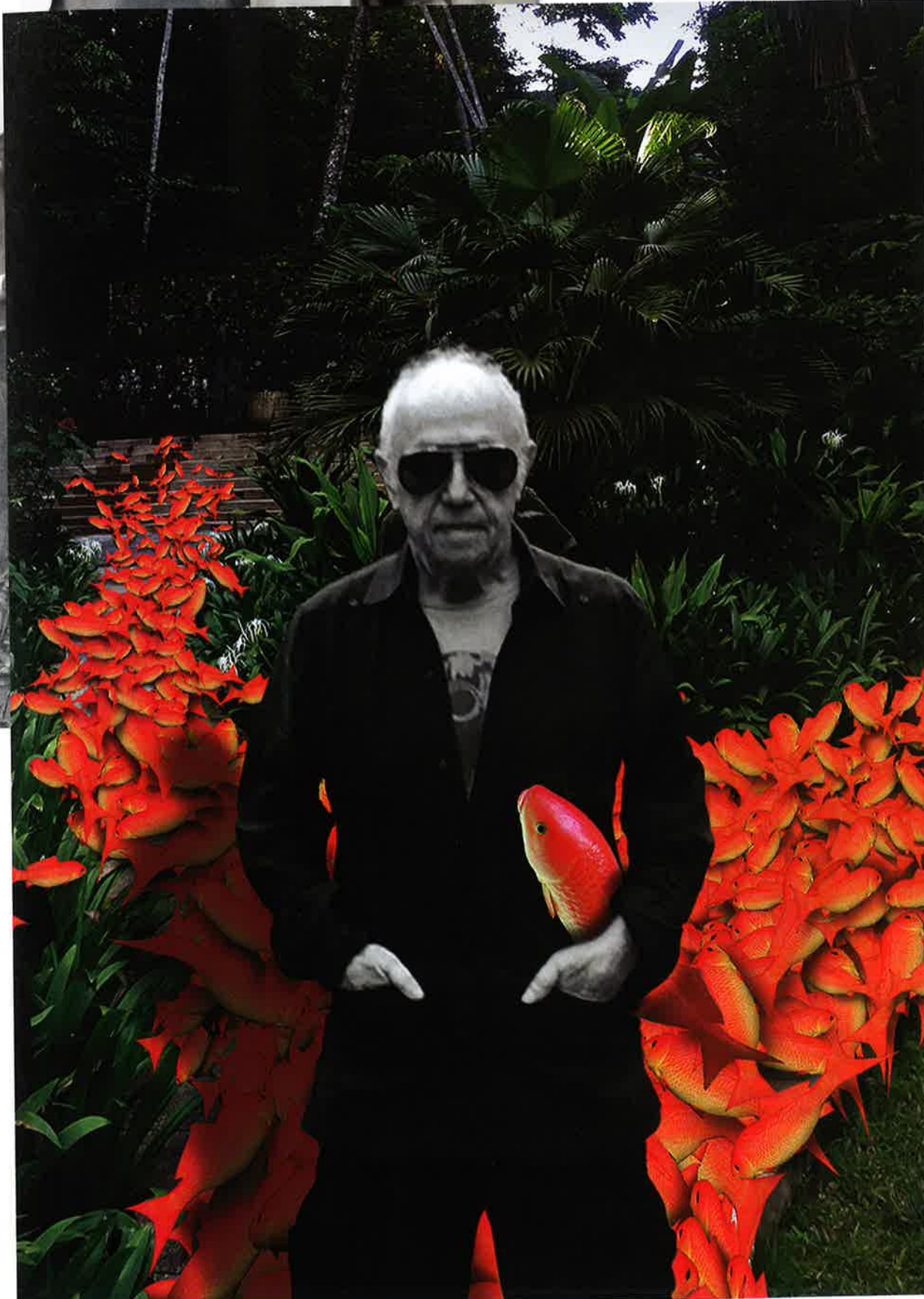
Souvenirs de Malaisie : autoportrait de Maurice Renoma dans une rivière de poissons rouges, symbolisant la pollution plastique qui submerge la planète.