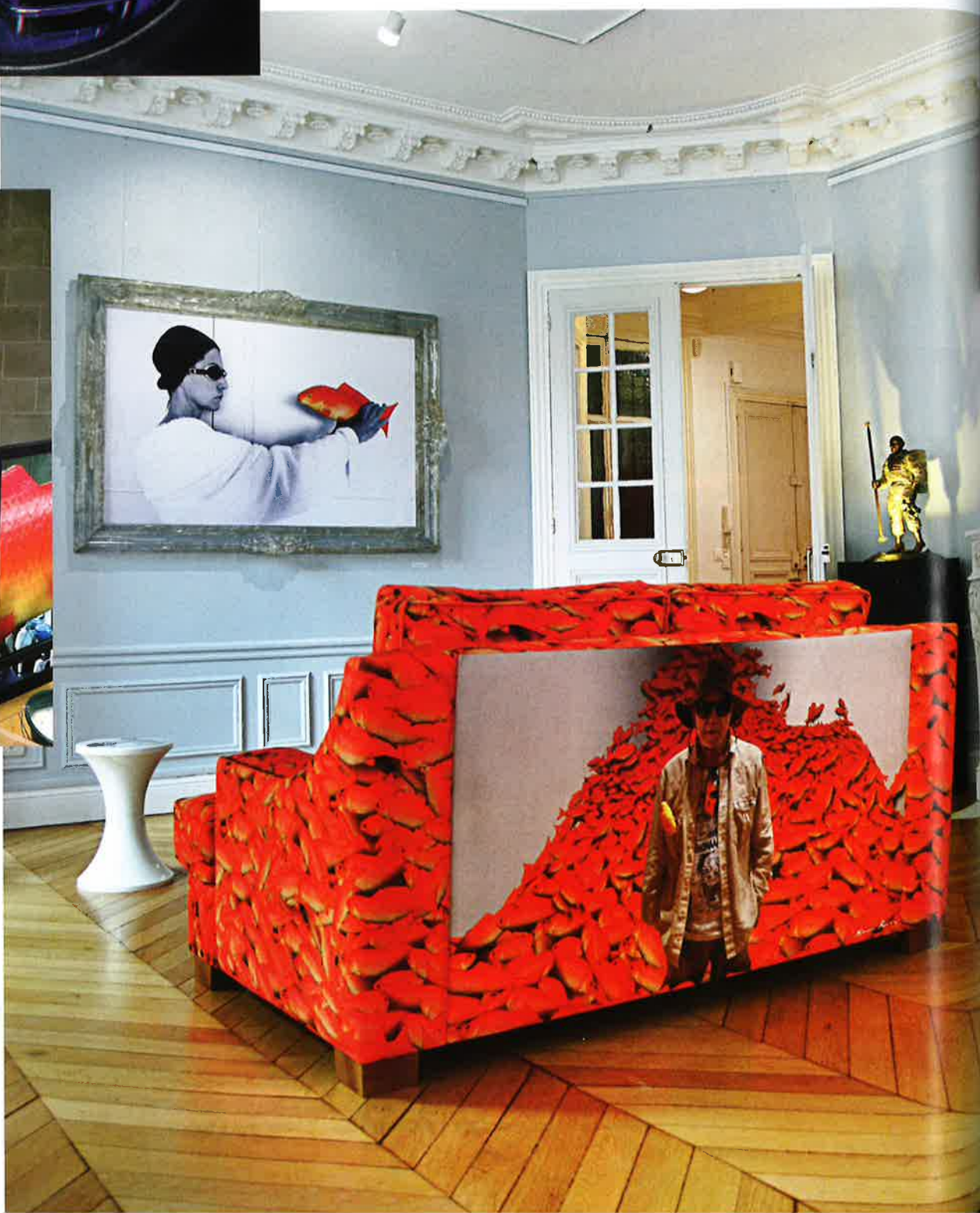
À droite : L'Appart, nouveau lieu hybride dédié aux échanges culturels et artistiques.