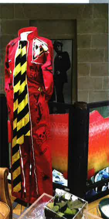
Ci-dessus, vue du premier étage de la boutique.