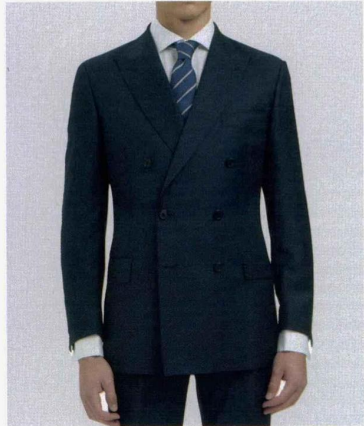
Gieves & Hawk