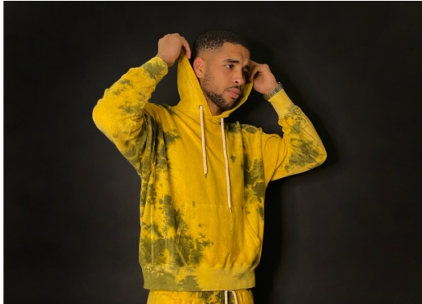
© Renoma / model : @_serjinho_94

[SAVE THE DATE] Est-ce un poisson d'avril ?