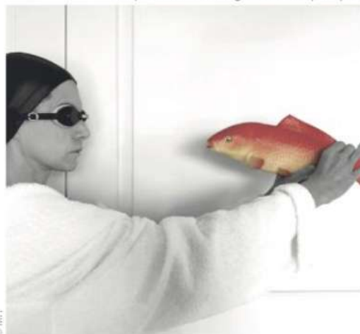
Face à face aquatique