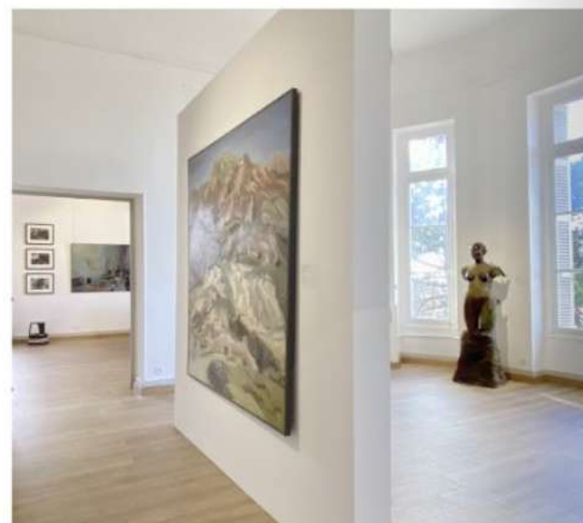
Quelques tableaux visibles Musée Villa Montebello

Reconstituer cette communauté historique depuis la première promotion, tisser le lien qui les unit en suivant le sillage de la Casa avant, pendant et après, permettra, sans aucun doute, de donner à notre public plaisir et fierté en même temps que cela donnera toute sa cohérence à l'offre picturale offerte par le Musée Villa Montebello.