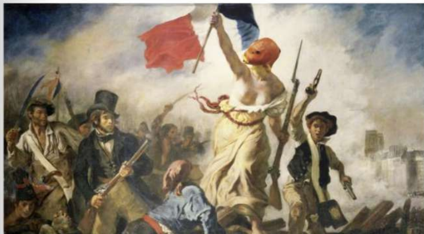
La poissonnière guidant le peuple