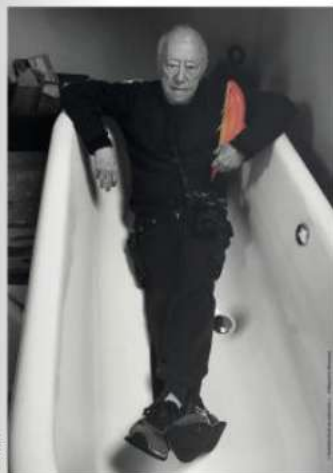
Autoportrait au poisson