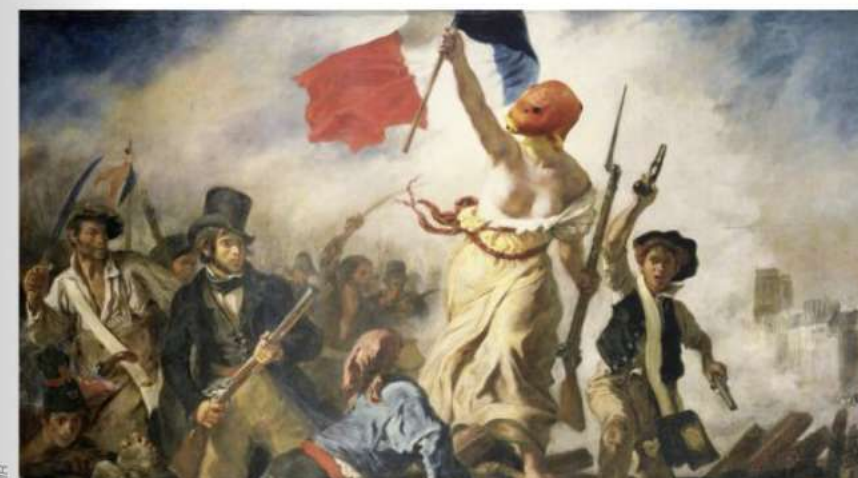
La poissonnière guidant le peuple