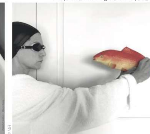
Face à face aquatique