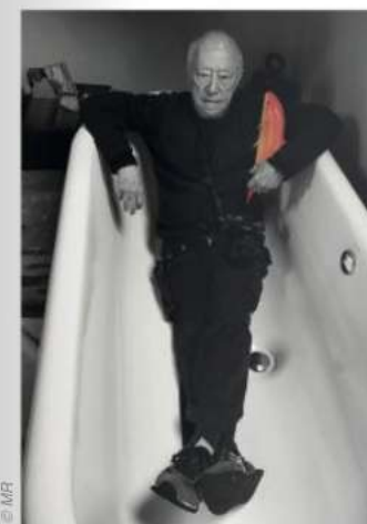
Autoportrait au poisson