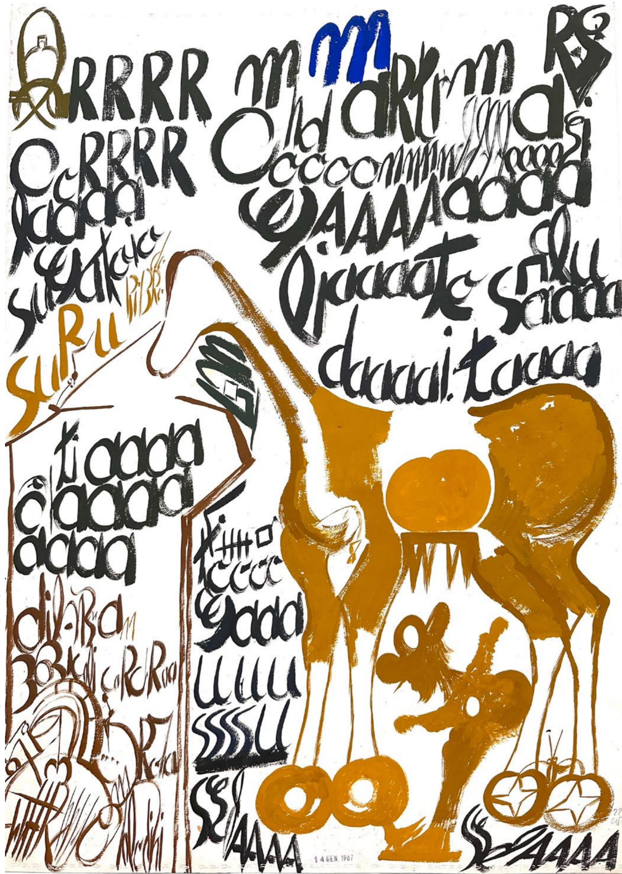
Carlo ZINELLI, 468 B - Cavallo su cerchi con figura barbata tra le zampe, 14 janvier 1967, 70 x 50 cm