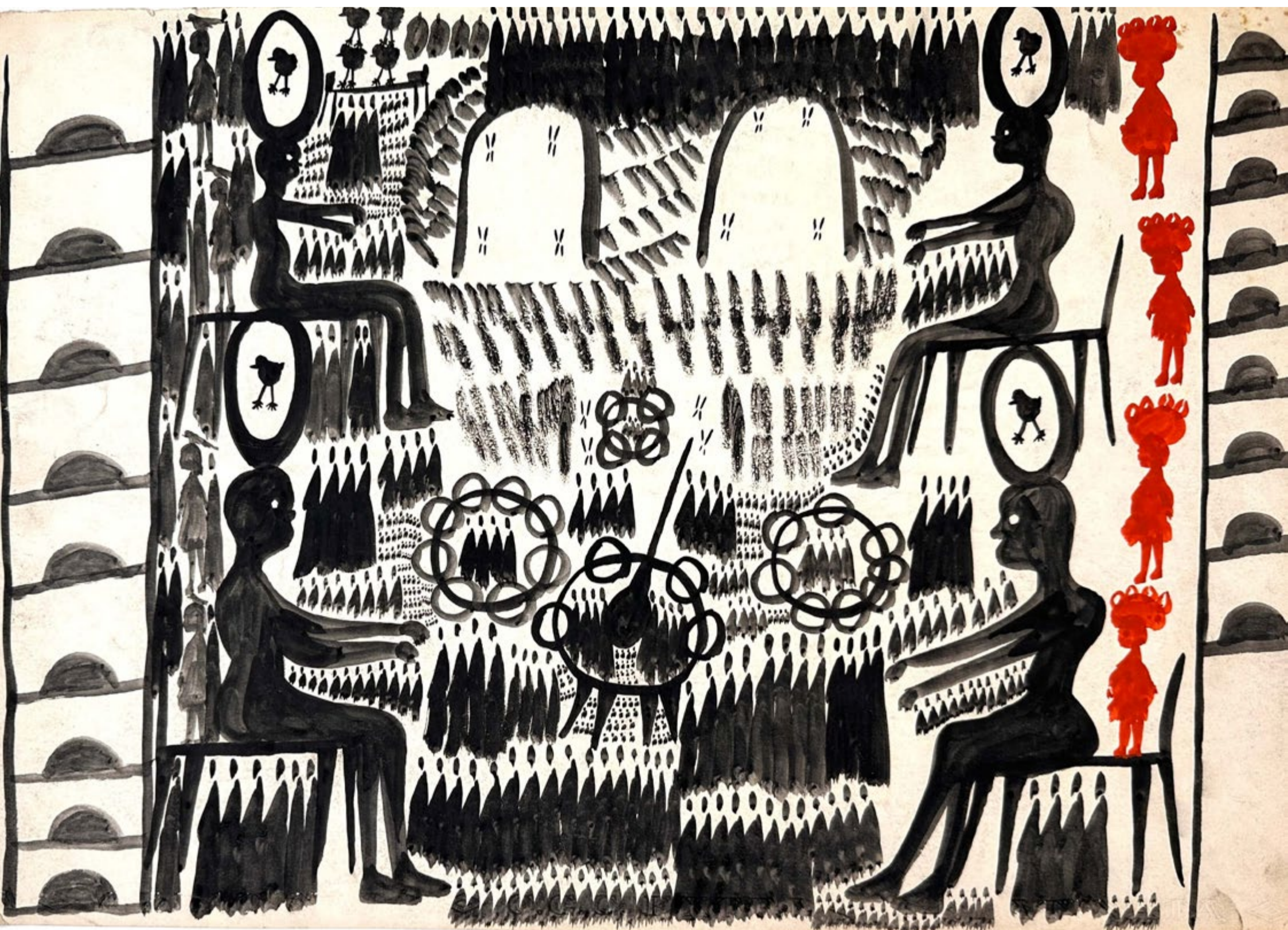
Carlo ZINELLI, Quattro uomini con uovo e uccello sulla testa , circa 1960, 35 x 50 cm