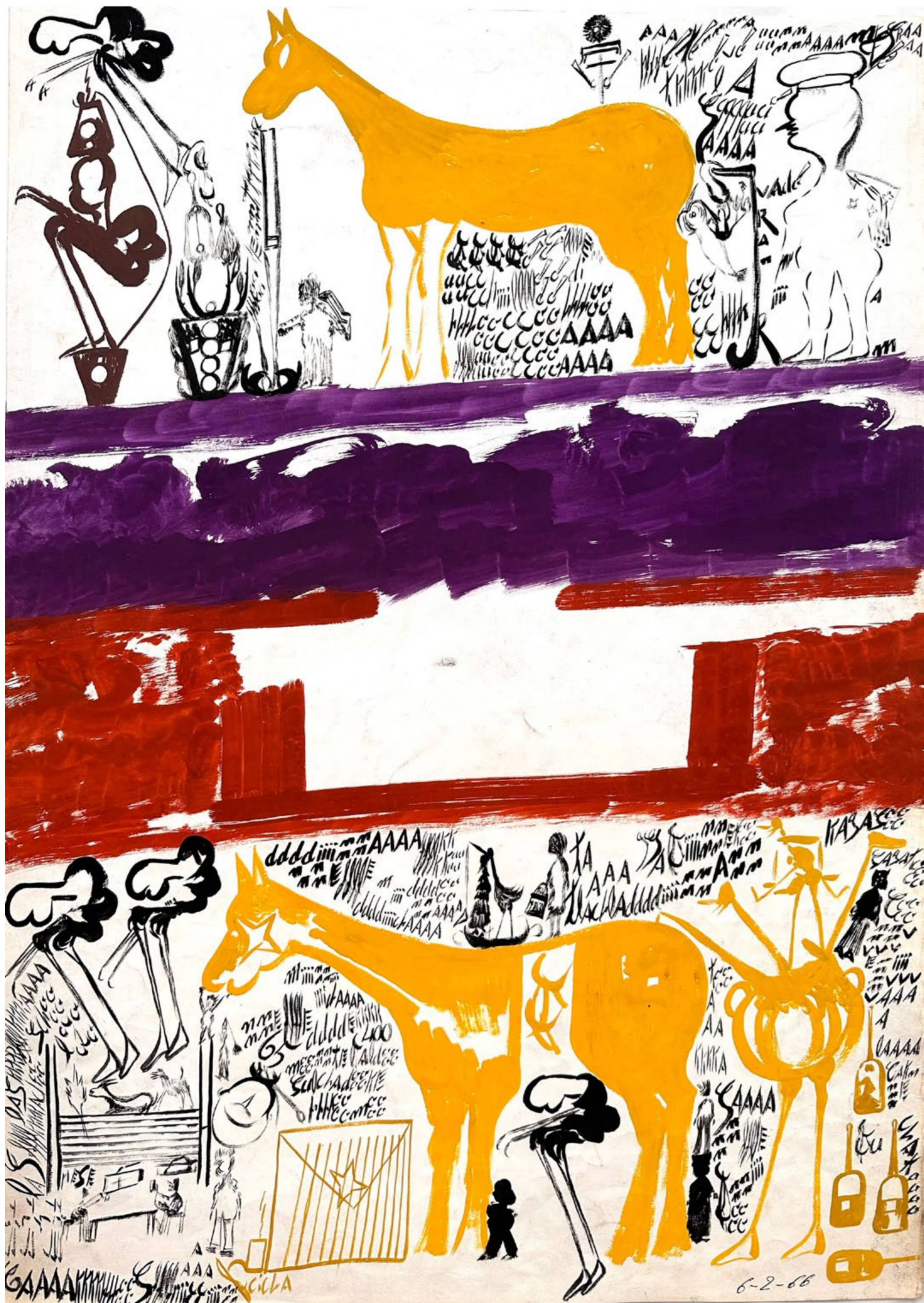
Carlo ZINELLI, 383 A : Due cavalli gialli con fasce viola e rossa, 6 février 1966, 70 x 50 cm

Cette figure de proue de l'art brut, qui en a aujourd'hui largement dépassé les frontières, a acquis une reconnaissance internationale et son œuvre a fait l'objet de nombreuses expositions personnelles comme à la Biennale de Venise, au Musée d'Art Moderne de la Ville de Paris ou au Museo di Castelvecchio de Vérone. Son œuvre est également présente dans de prestigieuses collections privées et publiques dans le monde comme la collection de l'Art Brut de Lausanne, le Centre Pompidou à Paris, la Collection du Musée d'art moderne Lille Métropole, ou l'American Folk Art Museum à New York.