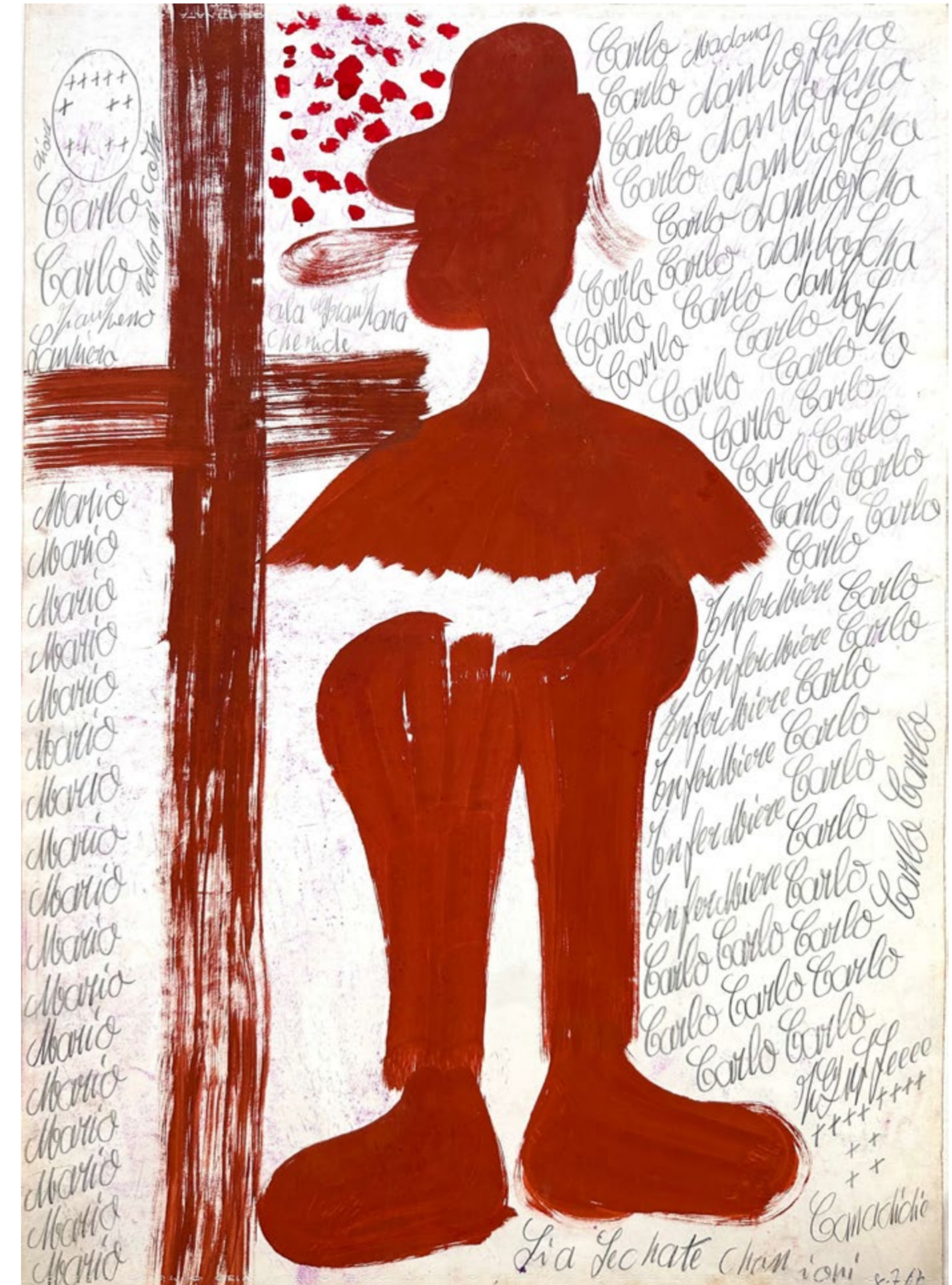
Carlo ZINELLI, 566 B - Grande cappello e croce rossi, 6 juillet 1967, 70 x 50 cm

PREVIEW PRESSE mardi 2 avril de 15h à 18h / VERNISSAGE jeudi 4 avril de 18h à 21h30