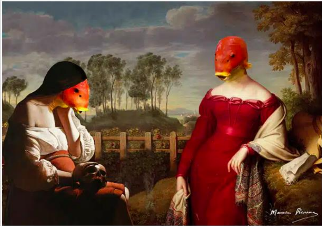
Anamorphose tout n'est pas caviar ou le jour du marché , conception graphique Maurice Renoma

À travers ce parcours immersif, cette collaboration inédite entre l'Aquarium et l'artiste qui est la première à donner carte blanche à un styliste de mode, s'inscrit dans le principe fondateur du lieu, à savoir éduquer et apprendre, notamment à l'égard du jeune public qui constituera la société de demain et qui sera acteur des choix sur le futur de la planète.