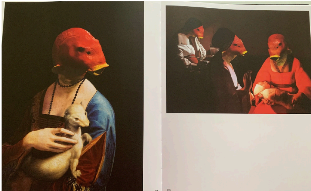
Maurice Renoma Hors cadre. Flammarion.

Par une esthétique « pulsionnelle », il a su créer, de la mode à l'image, un univers transgressif et foisonnant. Retracer tant ses 60 ans de création que sa personnalité haute en couleur, telles sont les ambitions de ce beau livre, le premier à mettre en lumière l'intégralité de son parcours artistique.